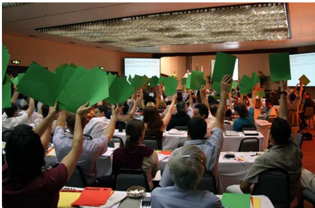
Valná hromada FSC v Manausu, Brazílie, prosinec 2005

Za tímto účelem organizace FSC vytvořila unikátní systém pro certifikaci lesního hospodaření a podniků zpracovatelského řetězce.