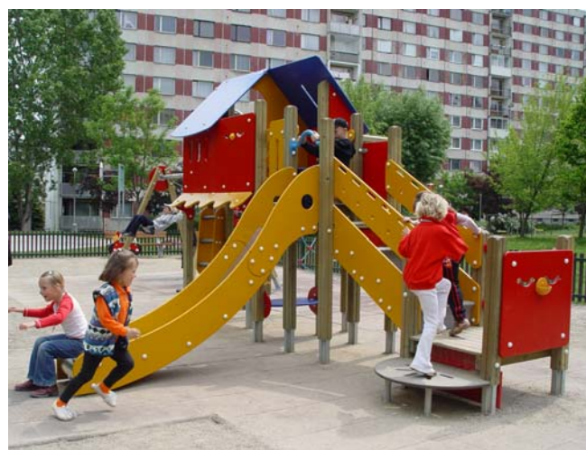
Dětská hřiště společnosti KOMPAN

Na hřištích s výrobní značkou KOMPAN si mohou děti z České republiky hrát již od roku 1994 v Praze i jiných českých a moravských městech. Dováží je výhradní dovozce do ČR, společnost TOJA. Základním materiálem používaným při výrobě hlavních částí hřišť KOMPAN je dřevo. Různé druhy dřeva jsou vybírány s ohledem na použití pro komponenty hřišť.