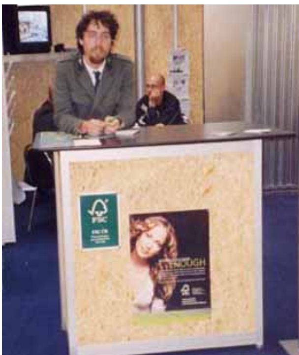
Informační stánek FSC ČR na veletrhu WOOD-TEC v říjnu 2003

Pracovní skupina pro certifikaci lesů FSC v ČR se ve dnech 18.–21. října 2003 zúčastnila mezinárodního veletrhu strojů, nástrojů, zařízení a materiálů pro dřevozpracující průmysl WOOD-TEC na brněnském výstavišti. Díky vstřícnému přístupu firmy Modiso, v.o.s., ze Šternberka, která FSC ČR poskytla prostor v rámci svého stánku v pavilonu V, měli pracovníci kanceláře FSC ČR možnost oslovit návštěvníky veletrhu z řad odborné i laické veřejnosti a konzultovat požadavky certifikačního systému FSC s řadou tuzemských i zahraničních dřevozpracovatelů. FSC ČR též využila příležitosti k prezentaci systému FSC v rámci doprovodného programu věnovanému certifikaci v lesním hospodaření a dřevařském průmyslu, organizovaného Mendlovou zemědělskou a lesnickou univerzitou na jejich stánku.