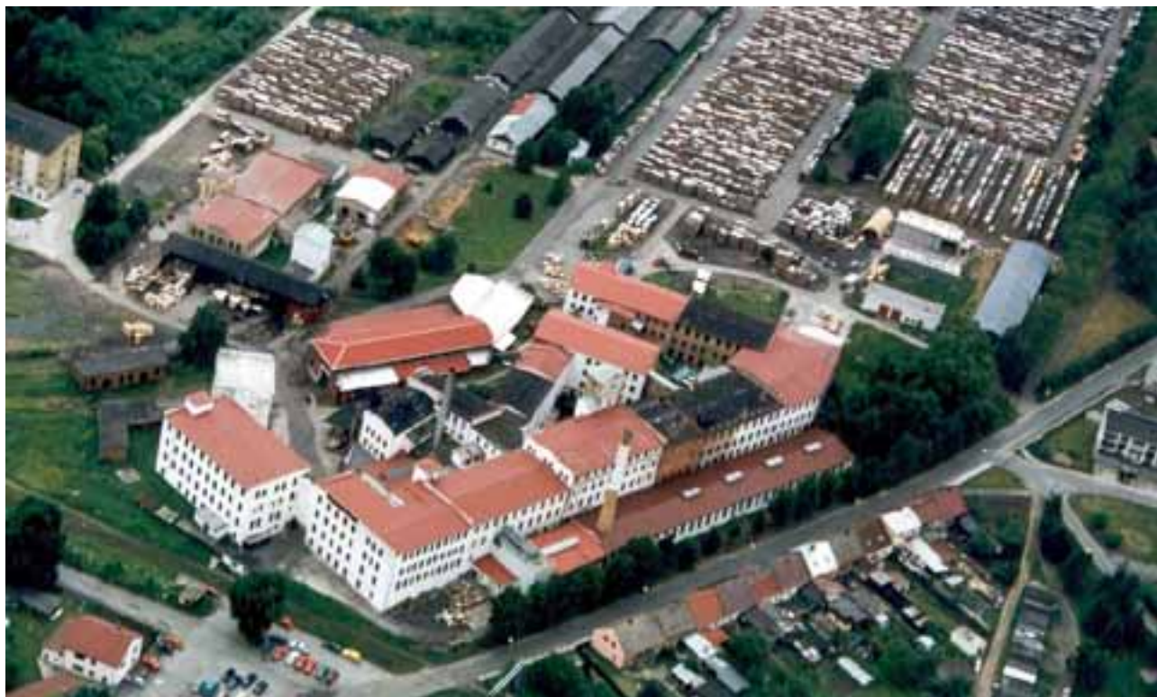
Podnik Falcon Mimoň, a. s., z letadla

Podnik v letošním roce předpokládá celkový vývoz ve výši zhruba 250 mil. Kč. Jako surovinu pro svou výrobu židlí nakupuje podnik vzduchosuché (a v současné době i čerstvé) hoblované i nehoblované bukové hranolky v objemu zhruba 300 m 3 měsíčně. Falcon má zájem navázat kontakt s dodavateli bukových hranolků certifikovaných systémem FSC. Podle generálního ředitele podniku byli všichni zaměstnanci Falconu seznámeni s cíli certifikace FSC a ve všech dílnách byly nainstalovány informační panely s prohlášením vedení společnosti, v němž vysvětluje svůj postoj k certifikaci a uvádí obecné informace o systému certifikace FSC.