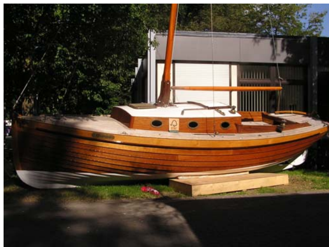
Jachta z certifikovaných dřevěných komponentů

V Německu v posledních měsících přesáhl počet certifikovaných dřevozpracovatelů a obchodníků s certifikovaným dřevem počet 300 a Polsko se tomuto počtu blíží. Velmi rychle přibývá certifikátů zpracovatelského řetězce též ve Švýcarsku (203) a Itálii (101), zajímavý je i nárůst v Rakousku v posledních měsících (30). Zvyšující se poptávka po FSC dřevě a výrobcích z těchto zemí, spolu s relativně stabilním zájmem o FSC certifikované výrobky ve Velké Británii, zemích Beneluxu a Dánsku, tvoří příležitost pro exportující české dodavatele. Certifikát FSC se stále častěji stává podmínkou obchodu.