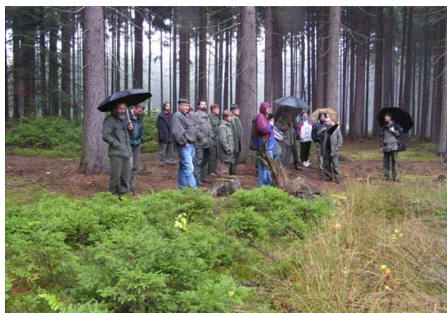
Exkurze na certifikované lesní majetky u Svitav, 5.11.2004