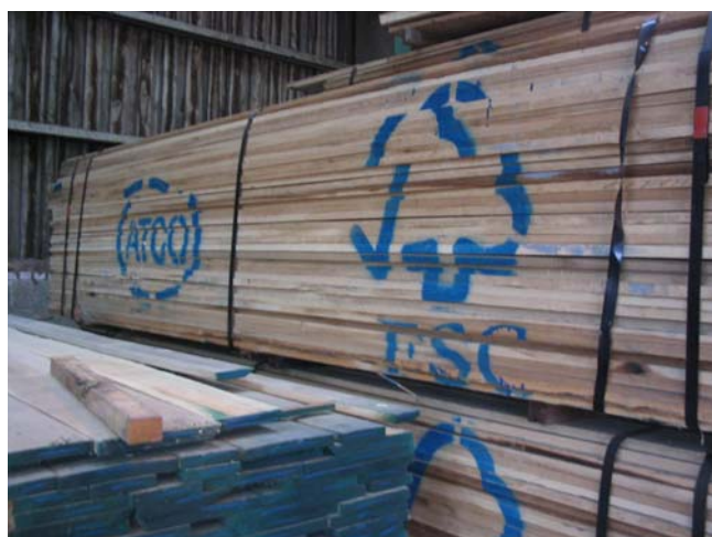
Ilustrační foto, FSC A.C.