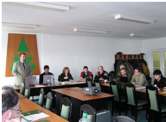
4. valná hromada FSC ČR