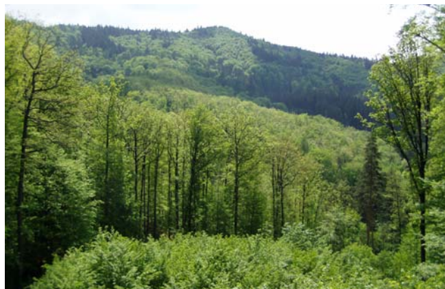
Certifikovaný lesní majetek Školního lesního podniku Masarykův les Křtiny