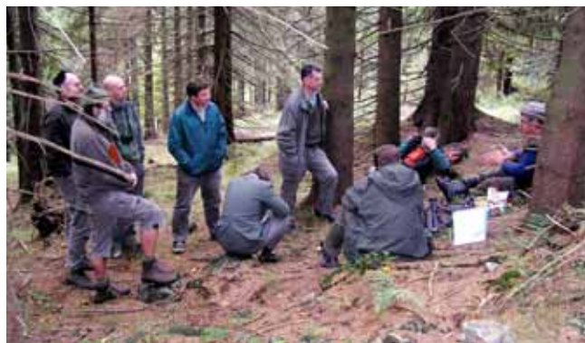
Účastníci terénního testu s pracovníky Správy KRNP na LS Harrachov