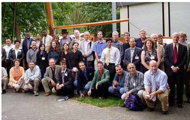
Zástupci národních iniciativ FSC před sídlem mezinárodního centra FSC v Bonnu

Budova byla oficiálně otevřena za účasti ministra životního prostředí, ochrany přírody a jaderné bezpečnosti Jürgena Trittina a starostky Bonnu Bärbel Dieckmann.