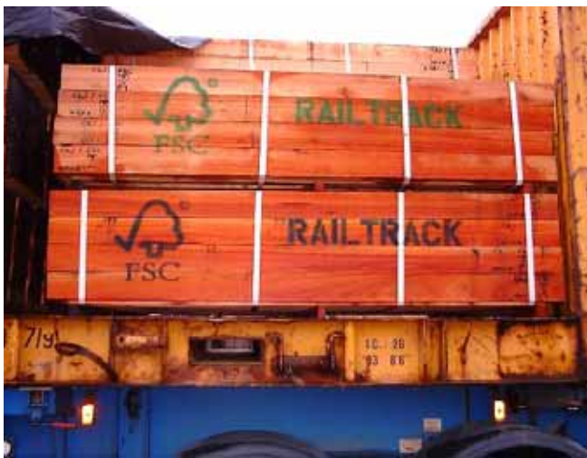
Foto: certifikované dřevo, ilustrační fotografie