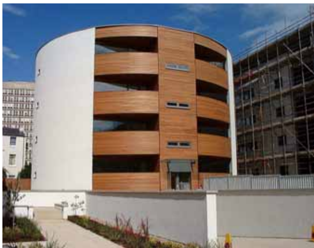
Nová budova soudu v Londýně, vystavěná s použitím výrazného podílu certifikovaného dřeva

Tři největší holandské společnosti zabývající se stavbou domů se zavázaly zvýšit podíl certifikovaného dřeva na svých stavebních projektech. ABN Amro, největší banka v Nizozemí, největší projektant rezidencí Bouwfonds a Vestia, největší sdružení pro sociálně dostupné bydlení v zemi, oznámili své plány na holandském veletrhu stavebnictví BouwRAI 2004 na přelomu března a dubna.