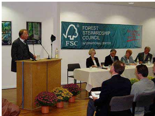
Ministr životního prostředí SRN Jürgen Trittin při slavnostním otevření mezinárodního centra FSC v Bonnu, 13. září 2004