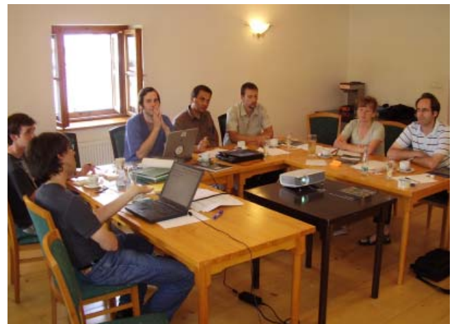
Jednání zástupců národních iniciativ FSC z České republiky, Slovenska a Německa

Zástupci FSC ČR, FSC Slovensko a FSC Německo dále diskutovali o možnosti přípravy a distribuce pravidelně aktualizovaného katalogu výrobků s logem FSC od českých a slovenských firem pro obchodní partnery v západní Evropě.