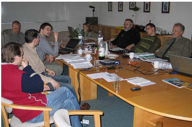
Zasadanie Komisie na tvorbu národného štandardu dňa 17. 3. 2006

Certifikačné organizácie budú musieť návrh slovenského FSC štandardu zohľadňovať pri každej ďalšej certifikácii lesov na Slovensku, čo by malo prispieť k jednotnému vysvetľovaniu a uplatňovaniu FSC princípov a kritérií a tým aj k zlepšeniu dôveryhodnosti FSC certifikácie na Slovensku.