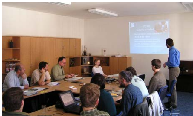
Foto: Jednání valné hromady FSC ČR, o. s.