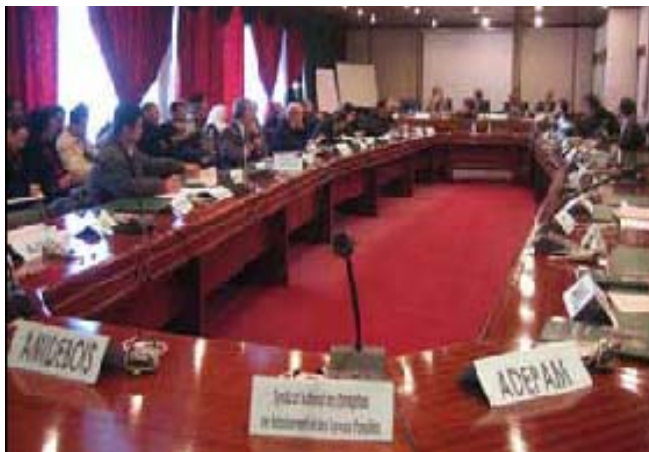
Foto: Seminár o FSC certifikácii, Rabbat.

Vláda Maroka sa rozhodla certifikovať štátne lesy podľa FSC. Zásluhu na tom má spolupráca medzi