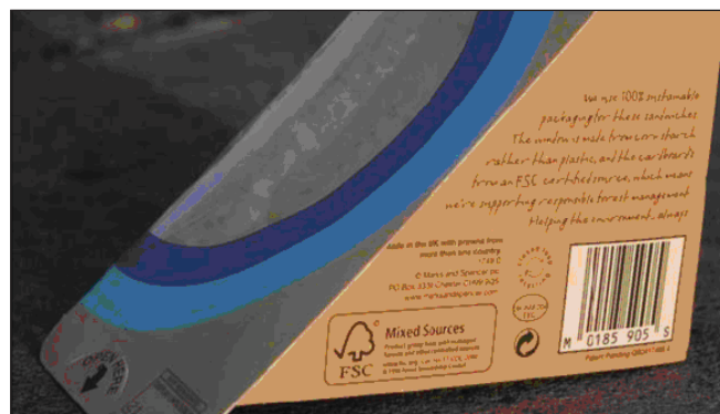
Obal z FSC certifikovaného papiera Marks and Spencer

Od roku 2012 sa Marks and Spencer (M&S), najväčší obchodný reťazec vo Veľkej Británii, zaviazal nakupovať výhradne výrobky z dreva s FSC certifikátom alebo z recyklovaných zdrojov. Päťročný plán tohto reťazca je nepochybne najodvážnejší s pomedzi záväzkov, ktoré kedy spravil niektorý obchodný reťazec.