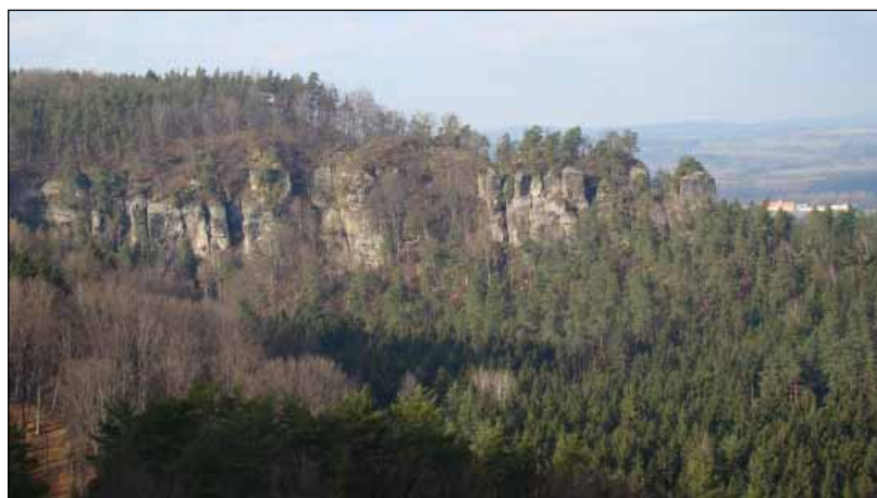
Ilustrační foto, Juraj Tužinský

Lesy České republiky, s. p. získaly první prestižní certifikát ekologicky a sociálně šetrného lesního hospodaření pro lesní hospodářský celek Žehrov, který je součástí lesní správy Nymburk. Lesní hospodářský celek Žehrov se rozkládá na ploše 2765 ha, částečně v chráněné krajinné oblasti Český ráj. Převažují borové porosty, větší podíl má ještě smrk a dub.