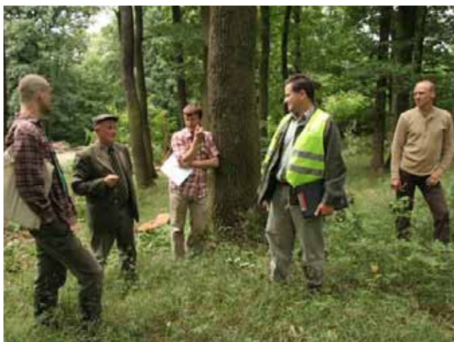
Ilustrační foto, Juraj Vysoký

V poslednom období na Slovensku výrazne vzrástol záujem o FSC certifikáciu lesov, najmä medzi neštátnymi lesnými subjektmi. Súvisí to najmä s tým, že ak sa vlastníci a užívatelia lesov uchádzajú o finančný príspevok v rámci lesníckych opatrení z Programu rozvoja vidieka SR na roky 2007–2013, pri vyhodnocovaní žiadostí získajú plusové body, ak hospodária v certifikovaných lesoch.