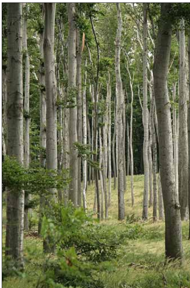
Ilustračné foto, Juraj Vysoký