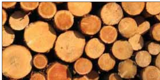
Ilustrační foto, Juraj Vysoký

Národná iniciatíva FSC Slovensko vypracovala prvú verziu hodnotenia rizika pre kontrolované drevo získavané zo zdrojov na Slovensku. Hodnotenie rizika je dôležitým krokom k jednotnému a správne uplatňovaniu konceptu „kontrolovaného dreva“ v rámci FSC certifikácie na Slovensku.