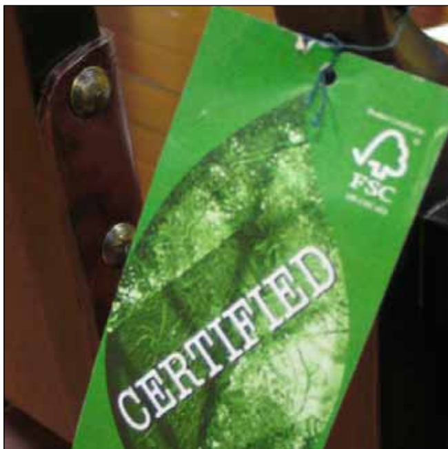
Ilustrační foto, Juraj Vysoký

Princípy a kritériá sú jedným zo základných dokumentov FSC, v ktorom je zadefinovaná filozofia dobrého obhospodarovania lesov.