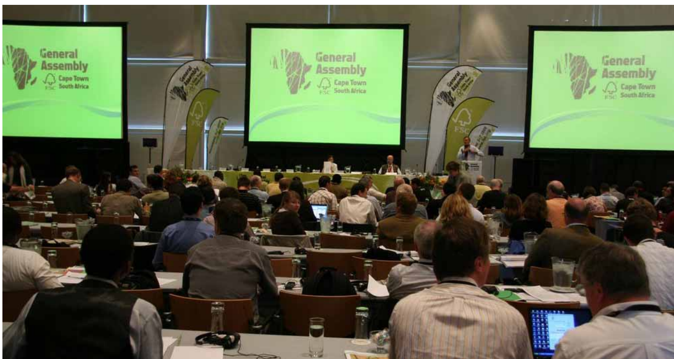
Valná hromada FSC, listopad 2008