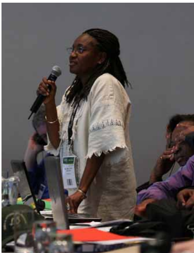
Valná hromada FSC, listopad 2008