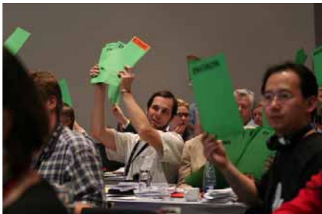
Valná hromada FSC, listopad 2008, foto Juraj Vysoký