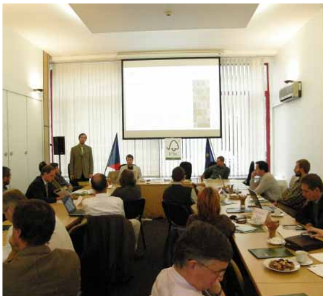
Valná hromada FSC ČR, září 2008