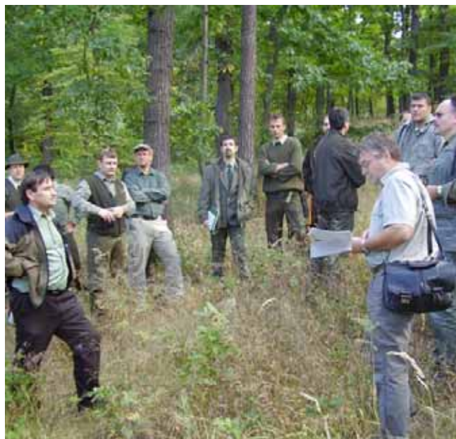
Exkurze do Kunratického lesa, září 2008