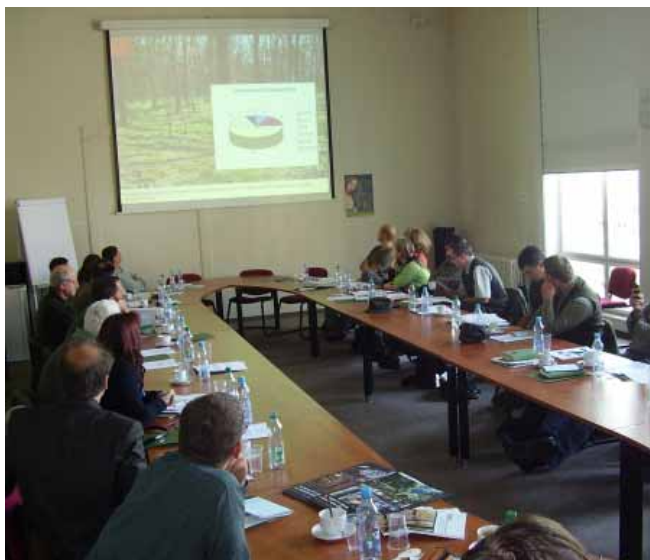
Seminář na pražském magistrátu, září 2008