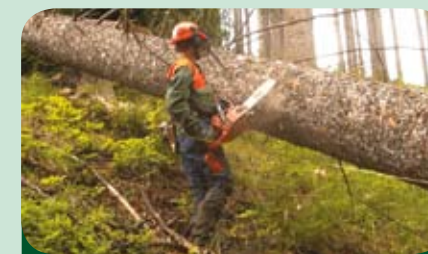
lesní práce prováděné podle standardů FSC