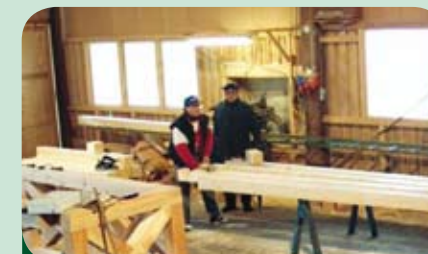
zpracovatelský závod certifikovaný FSC