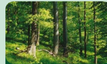
les s certifikátem FSC