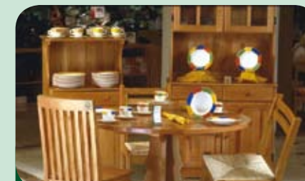
produkt s logem FSC